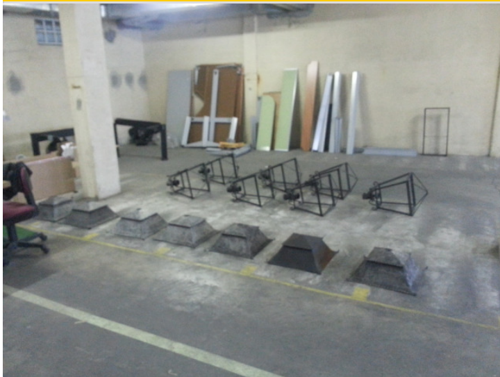
Ateliers de rénovation